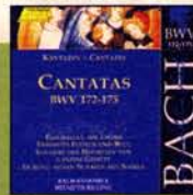
Bach-Kantaten in diversen Einspielungen