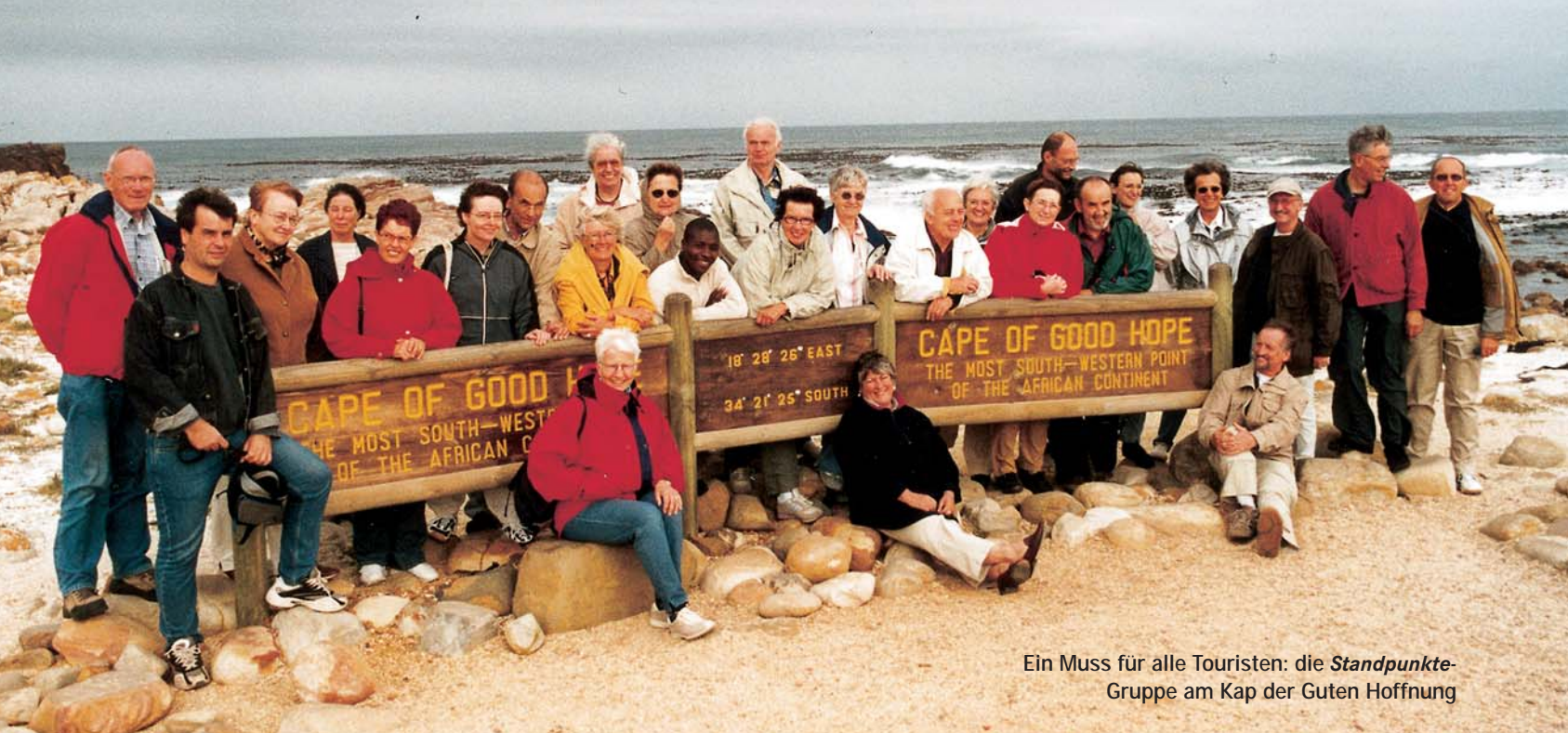
Ein Muss für alle Touristen: die Standpunkte-Gruppe am Kap der Guten Hoffnung