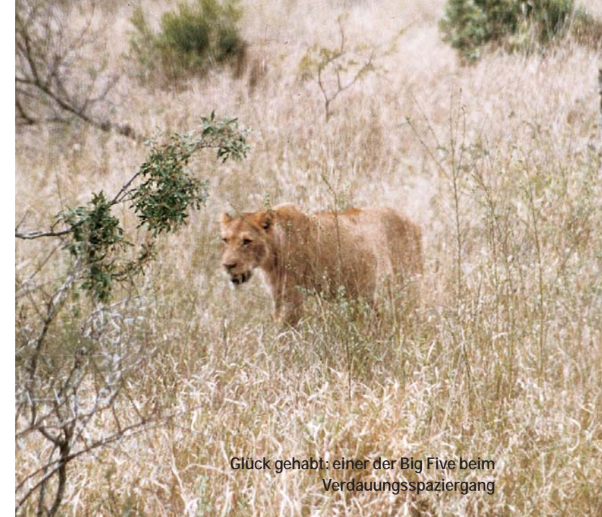
Glück gehabt: einer der Big Five beim Verdauungsspaziergang

Die bezaubernde Schönheit der Pflanzen- und Tierwelt, das Einssein mit der Natur, wenn nach dem Sonnenuntergang die Stimmen der Wildnis erwachen, die Brandung der Meere am Kap der Guten Hoffnung, die fröhliche Gelassenheit der Menschen, Reichtum und Armut dicht nebeneinander, Luxuspaläste und Hütten ohne Strom und Wasser, Widersprüche – aber auch Hoffnung der Regenbogennation. – All das war hineingepackt in diese Reise. Die Bilder Südafrikas werden bleiben, nicht nur als schöne Erinnerung, sondern auch als Auftrag. HILDEGARD HAUSER, ACHERN-SASBACHRIED