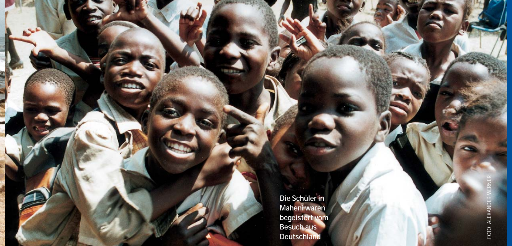
Die Schüler in Maheni waren begeistert vom Besuch aus Deutschland